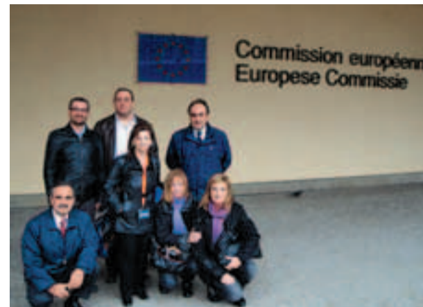
Delegazione a Bruxelles

supporto operativo diretto nell'attuazione delle politiche dell'Unione Europea.