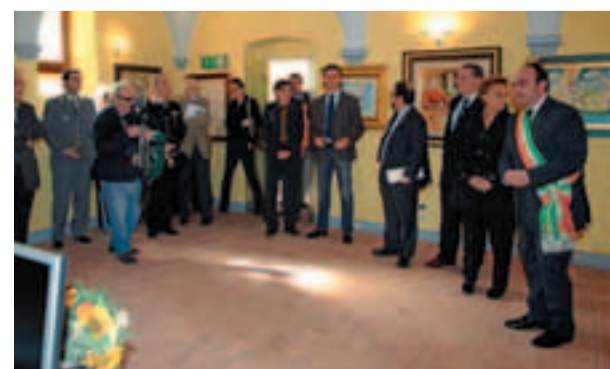
La sede universitaria