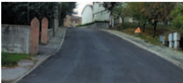
Via San Giovanni

Due strade comunali situate vicino all'area degli impianti sportivi. Un altro intervento sul patrimonio viario la cui sistemazione ha previsto la realizzazione di una serie di opere finalizzate ad incentivare la sicurezza stradale, riqualificare i sottoservizi primari e migliorare la funzionalità della viabilità. L'intervento, rientrava nella programmazione generale di ristrutturazione del patrimonio viario predisposto dalla Giunta e a ciò si sono aggiunti anche i lavori programmati di concerto con la Multiservizi SpA che hanno riguardato la sistemazione della rete fognaria ed idrica.