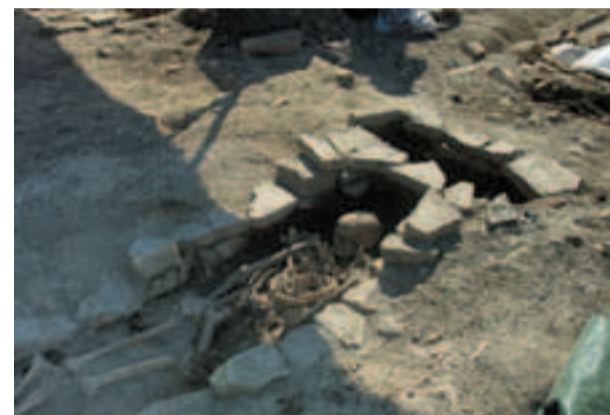
Ritrovamento della tomba durante gli scavi

del Dipartimento dell'Ateneo bolognese, coordinati dal Prof. Dall'Aglio, ha portato alla luce preziosi mosaici, oggetti vari e numerose tombe, che si uniscono a quanto rinvenuto negli anni precedenti.