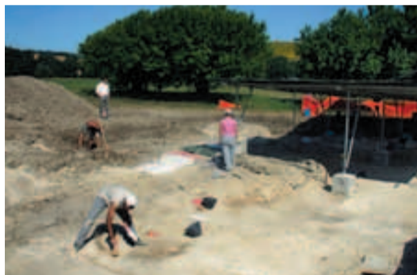
Scavi nell'Area Archeologica

Una visita per fare il punto della situazione sugli scavi nel sito archeologico di Ostra Vetere che quest'anno hanno portato alla luce le mura di un altro edificio adiacente il tempio romano. L'attività di scavo, realizzata dagli esperti