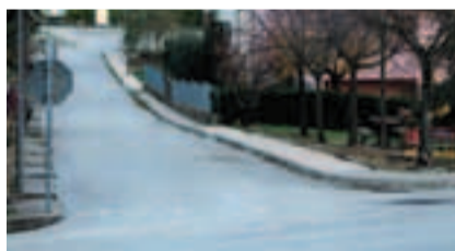
Nuovi marciapiedi Colle Paradiso

cantieri consistenti e innovativi per Ostra Vetere che possono essere così riassunti: - € 396.000 Costruzione loculi cimiteriali (1° stralcio);