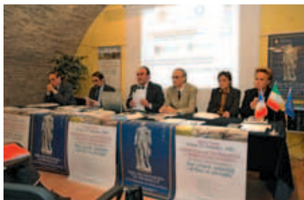
Momento della cerimonia inaugurale della sede universitaria

Ostra Vetere è anche "Città Universitaria". Il 27 settembre scorso si è svolta l'inaugurazione della sede universitaria e l'apertura ufficiale del primo anno accademico del Corso di Studi in "Beni culturali, ambientali e gestione del paesaggio", nato dalla collaborazione tra l'Amministrazione comunale e l'Università degli Studi di Bologna.