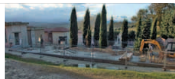
Cantiere al cimitero

Questi sono alcuni investimenti che la Giunta ha progettato e sta progettando, ha realizzato e sta realizzando. Alcune opere sono terminate, altre sono ai nastri di partenza. Poi, c'è l'acquisto di Arredo Urbano (panchine, posacenere, nuova cartellonistica stradale, cestini, etc.); Manutenzione ordinaria delle strade e del patrimonio pubblico; Acquisto mezzi comunali (ad esempio, auto di servizio dei vigili, tagliaerba); Impianto di filodiffusione nel centro storico; Estensione e potenziamento della rete di metanizzazione nell'intero territorio della frazione di Pongelli.