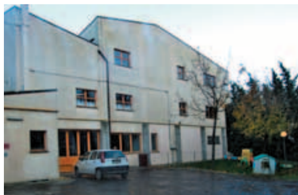
Asilo Nido "Gheos"

Da sottolineare gli interventi manutentivi straordinari effettuati ultimamente nell'immobile che ospita il Nido e la Materna relativi al rifacimento dell'impianto fognario, del piazzale e del parco-giochi.