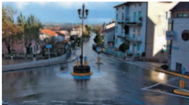
La nuova rotatoria

turale di una parte del patrimonio viario, che prevede, tra gli altri interventi, anche quello, non solo della sicurezza ma della riqualificazione estetica dell'incrocio alle porte della città."