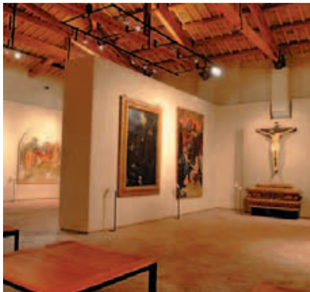
Una delle sale del Museo-Pinacoteca