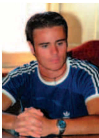
Il Vice Sindaco Daniele Api

Varato dal Governo locale il “Pacchetto Giovani”, predisposto dal Sindaco Massimo Bello e dal Vice Sindaco Daniele Api, che ha la delega alle Politiche Giovanili. Il “Pacchetto Giovani” approvato prima dalla Giunta e poi dal Consiglio Comunale è composto da una serie di misure e azioni volte a favorire il processo di socializzazione, d'espressione e di autodeterminazione e alla creazione di