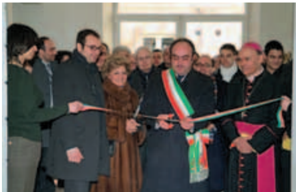
Il taglio del nastro al Museo-Pinacoteca

Inaugurato il Museo-Pinacoteca. Il Sindaco Bello: "Nasce finalmente la cittadella della cultura"