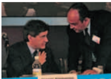
Il Sindaco Alemanno e il Sindaco Bello a Trieste

Due Amministratori hanno partecipato all'Assemblea annuale dell'ANCI (Associazione Nazionale dei Comuni Italiani), che si è svolta a Trieste a ottobre scorso. L'appuntamento nazionale ha offerto l'opportunità ai Comuni di esaminare e approfondire alcuni dei temi più importanti all'ordine del giorno degli Enti Locali, anche in relazione agli ultimi provvedimenti e alle proposte di riforma del Governo in materia di finanza locale, di politiche sociali, servizi pubblici, ambiente, politiche giovanili, catasto, urbanistica, sicurezza, sussidiarietà e assetto delle istituzioni. Tra gli ospiti e i relatori, erano presenti anche il Sindaco di Roma Gianni Alemanno, il Sindaco di Firenze Leonardo Dominici, il Sindaco di Reggio Calabria Giuseppe Scopelliti, oltre ai Sindaci di Milano Letizia Moratti, di Trieste Roberto Dipiazza, di Ancona Fabio Sturani e molti altri cittadini di piccoli, medi e grandi Comuni, tra questi anche Ostra Vetere. Presenti anche i Ministri Raffaele Fitto, Roberto Calderoli, Roberto Maroni, Renato Brunetta.