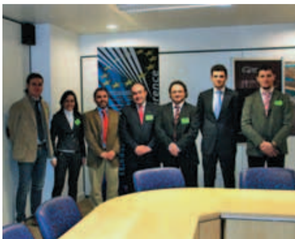
Amministratori e imprenditori a Bruxelles

L'iniziativa messa in piedi dall'Amministrazione nasce proprio all'indomani della sottoscrizione del Protocollo d'Intesa tra la Regione Marche e il Comune di Ostra Vetere (che è il primo Comune delle Marche a firmare con la Regione un Accordo che lo mette in contatto direttamente con gli uffici regionali che hanno sede, appunto, a Bruxelles) che dà la possibilità al Comune di ottenere un