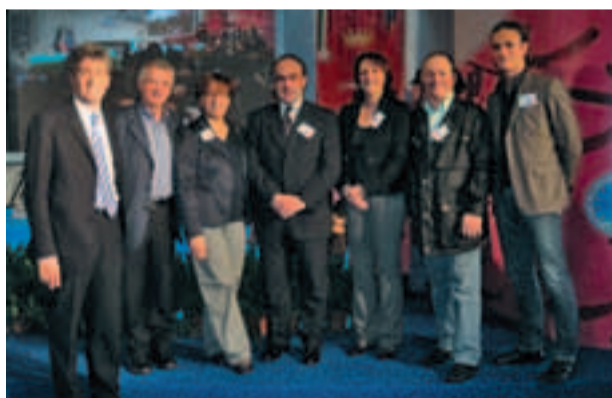
Delegazione sindaci a Trieste