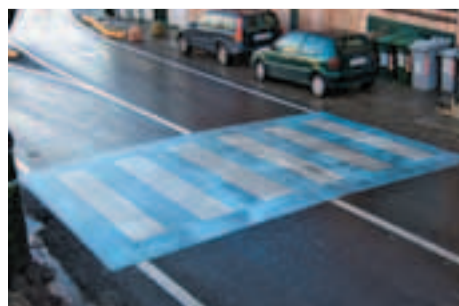
Strisce pedonali nelle adiacenze della rotatoria