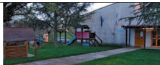
L'ingresso della Scuola Materna