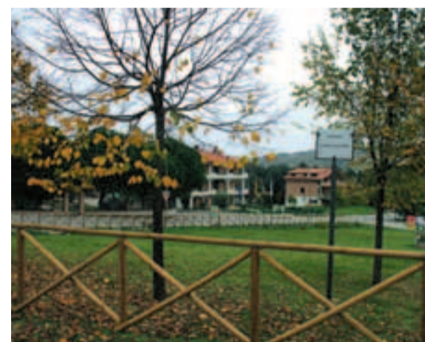
I giardini di pongelli

Una piccola opera di arredo urbano per migliorare due aree verdi situate nella frazione Pongelli di Ostra Vetere. Un piccolo intervento urbano che ha senz'altro migliorato i due giardini pubblici, che sono stati oggetto di installazione di staccionate in legno al fine di delimitare in modo ordinato le due zone. È stata inoltre posta una piccola "fontanella", delle aste con bandiere, una nuova pensilina, nuove panchine, e una nuova bacheca. Risistemata anche la staccionata di legno adiacente la scalinata che porta al piazzale della Chiesa di Pongelli.