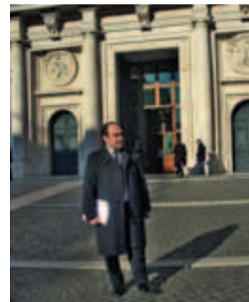
Il Sindaco a Roma in Piazza Montecitorio

Missione del Sindaco a Roma per presentare alcuni progetti dell'Amministrazione comunale relativi alle infrastrutture e all'area archeologica. Il primo cittadino, lo scorso novembre, ha incontrato parlamentari e membri del Governo, a cui ha illustrato alcuni progetti predisposti ed approvati dalla Giunta, e con loro ha individuato le forme di finanziamento per realizzarli. "Si tratta di progetti - ha detto il Sindaco - importanti e qualificanti per Ostra Vetere a cui tengo in particolare modo."