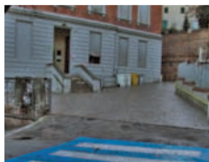
Entrata della Scuola Elementare

Realizzati i lavori di riqualificazione e di manutenzione straordinaria dei plessi scolastici di Ostra Vetere (scuola elementare, scuola media, scuola materna, asilo nido e centro diurno) che l'Amministrazione comunale aveva pro-