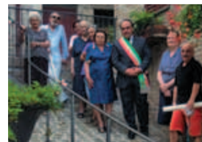
Inaugurazione del passaggio di Via Fiorenza