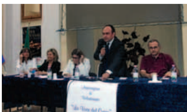
Il Sindaco presenta la nuova Associazione La Voce del Cuore di Ostra Vetere